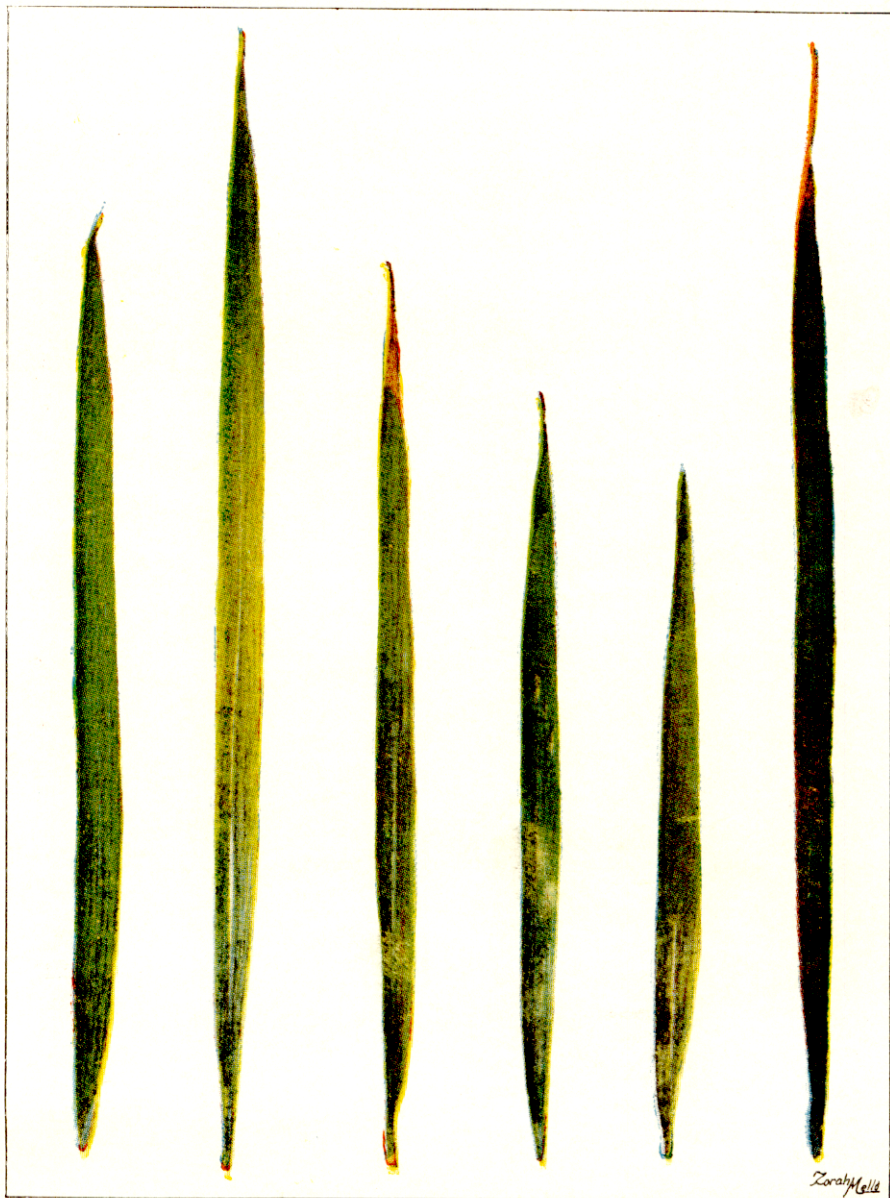
Fólha normal de arroz ao lado de outras com sintomas de deficiência de zinco.