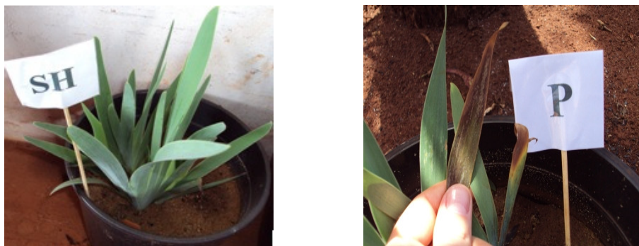
Figura 3. Plantas em solução de Hoagland & Arnon completa (SH) e sintomas visuais de deficiência nutricional pela omissão de P.

favorece a síntese de antocianina, pigmento que confere essa coloração (Mengel & Kirkby, 1987). Entre as importantes funções exercidas pelo P na planta, o relevante papel na síntese de proteínas determina que sua carência acarrete o menor crescimento vegetal (Malavolta, 2006; Marschner, 1995).