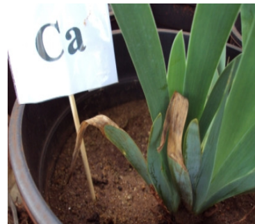
Figura 5. Plantas em solução de Hoagland & Arnon completa (SH) e sintomas visuais de deficiência nutricional pela omissão de Ca.