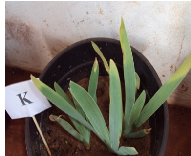
Figura 4. Plantas em solução de Hoagland & Arnon completa (SH) e sintomas visuais de deficiência nutricional pela omissão de K.

As plantas de Iris que não receberam cálcio apresentaram diminuição no seu crescimento além de folhas com as margens recortadas e tortas e também com pontas necróticas (Figura 5). A falta de cálcio é caracterizada pela redução do crescimento de