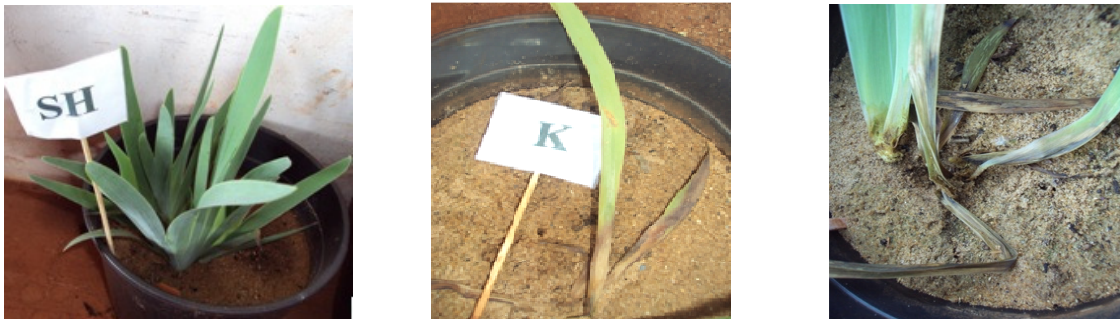
Figura 1. Plantas em solução de Hoagland & Arnon completa (SH) e aumento da severidade de bacteriose ( Erwinia spp.) devido à deficiência de K.

Apesar da colheita antecipada de Iris germanica L., devido à bacteriose, houve diferença na expressão dos sintomas de deficiência dos macronutrientes omitidos. A infecção teve início na região do colo, evoluindo para escurecimento da haste, acompanhada de decomposição (podridão mole) da medula. A infecção foi mais severa nos tratamentos com omissão de K (Figura 1). Dentre os nutrientes, o potássio (K) é citado como um dos que tem maior influência sobre as doenças de plantas, por ser crucial em muitas reações metabólicas da mesma. O fornecimento equilibrado de potássio à planta diminui a incidência de doenças em razão do aumento da resistência à penetração e desenvolvimento de alguns patógenos (Perrenoud, 1990). Além de aumentar a espessura da parede celular, o K proporciona maior rigidez dos tecidos, regulação funcional dos estômatos e promovem a rápida recuperação dos tecidos injuriados (Marschner, 1995).