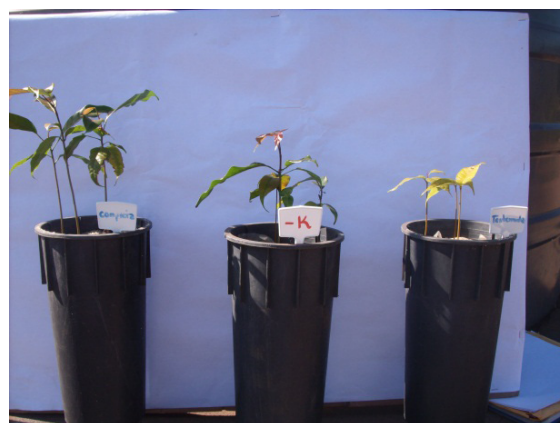
Figura 8. Detalhes de plantas de mogno africano tratadas com soluções nutritivas completa, com omissão de potássio e testemunha, aos 210 dias após início dos tratamentos.

Para Malavolta et al. (1997), o sintoma de deficiência nutricional de potássio, se manifesta com o aparecimento de clorose e necrose nas margens das folhas velhas. Faquin (2005) atribui esse evento ao acúmulo de putrescina, causado pela redução na síntese protéica e acúmulo de aminoácidos básicos em plantas deficientes em K.