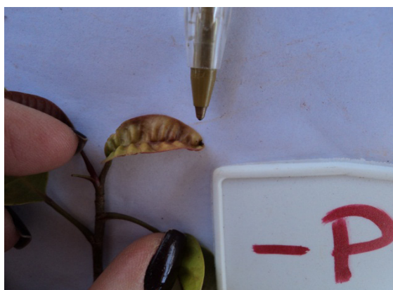
Figura 5. Detalhes de plantas de mogno africano tratadas com solução nutritiva com omissão de fósforo, aos 210 dias após início dos tratamentos.