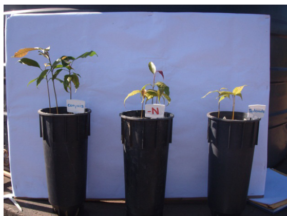
Figura 2. Detalhes de plantas de mogno africano tratadas com soluções nutritivas completa, com omissão de nitrogênio e testemunha, aos 55 dias após início dos tratamentos.

Esses sintomas são semelhantes aos observados por Silva & Falcão (2002), que caracterizaram os sintomas de carência nutricional, com omissão de N, em mudas de pupunheira ( Bactris gasipaes Kunth) cultivadas em solução nutritiva.