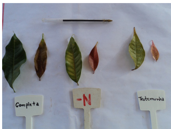
Figura 1. Folhas de mogno africano tratadas com soluções nutritivas completa, com omissão de nitrogênio e testemunha, aos 210 dias após início dos tratamentos.

Após 40 dias de uso da solução nutritiva sem N, as plantas começaram a apresentar sintomas de deficiência. Esses sintomas foram observados primeiramente nas folhas mais velhas, com clorose seguida de necrose nas margens e senescência. Posteriormente, esses sintomas foram observados também nas folhas jovens. Essas mostraram-se pequenas, com coloração vermelho-pálidas (Figura 1). No decorrer dos dias, esses sintomas se tornaram generalizados em toda a planta (Figura 2), tendo-se observado, também, a pouca quantidade de novas brotações.