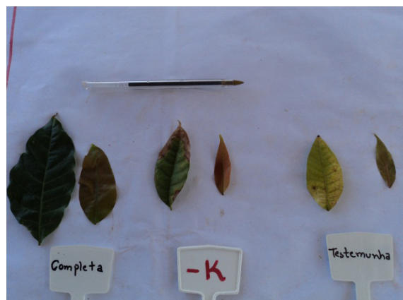
Figura 7. Folhas jovens e adultas de plantas de mogno africano tratadas com soluções nutritivas completa, com omissão de potássio e testemunha, aos 210 dias após início dos tratamentos.

O quadro sintomatológico descrito está concordante com Silva & Falcão (2002) que observaram os mesmos sintomas em mudas de pupunheira cultivadas em solução nutritiva com omissão de potássio. Viégas et al. (2004), avaliando a nutrição em plantas de camucamuzeiro ( Myrciaria dubia ), relataram sintomas de deficiência de potássio, caracterizados inicialmente por pequenas necroses nos bordos e nos ápices das folhas mais velhas, as quais, com a intensidade da deficiência, evoluíram e formaram grandes manchas necróticas no limbo foliar. Outros resultados aos obtidos nesta pesquisa, com a omissão de potássio na solução nutritiva para mudas de mogno africano, foram observados por Salvador et al. (1994) em plantas cupuazeiro, por Gonçalves et al. (2006) em umbuzeiro, por Silva et al. (2009) em pinhão-manso, por Moretti et al. (2011) em cedro australiano e por Sarcinelli et al. (2004) em Acacia holosericea .