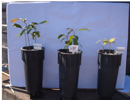
Figura 4. Detalhes de plantas de mogno africano tratadas com soluções nutritivas completa, com omissão de fósforo e testemunha aos 55 dias após início dos tratamentos.

Salvador et al. (1994) também observaram manchas verde-limão nas folhas velhas e encarquilhamento nas folhas jovens de mudas de cupuazeiro cultivadas em solução nutritiva com omissão de P.