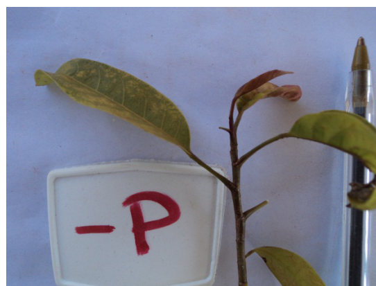
Figura 6. Detalhes de plantas de mogno africano tratadas com solução nutritiva com omissão de fósforo, aos 210 dias após início dos tratamentos.

Sintomas diferentes foram descritos por Silva et al. (2009) que observaram, em mudas de pinhão-manso, a partir de 40 dias de aplicação do tratamento, o aparecimento de coloração arroxeada nos bordos e na parte abaxial das folhas velhas, evoluindo para necrose nas folhas afetadas, e por Silveira et al. (2002) que verificaram cor verde-escuro seguida de arroxeamento nas folhas velhas de mudas de Eucalyptus grandis e E. urophylla cultivados em solução nutritiva com omissão de P.