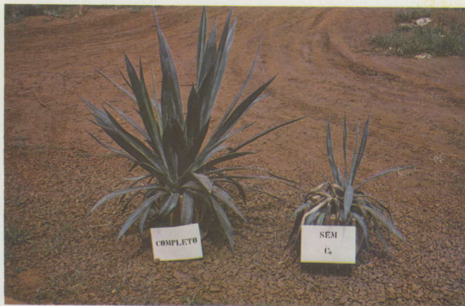
Figura 4. — Plantas tratadas com omissão de cálcio comparadas com as do tratamento completo