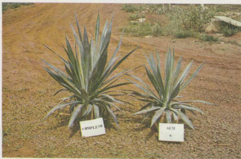
Figura 6. — Plantas tratadas com omissão de enxofre comparadas com as do tratamento completo