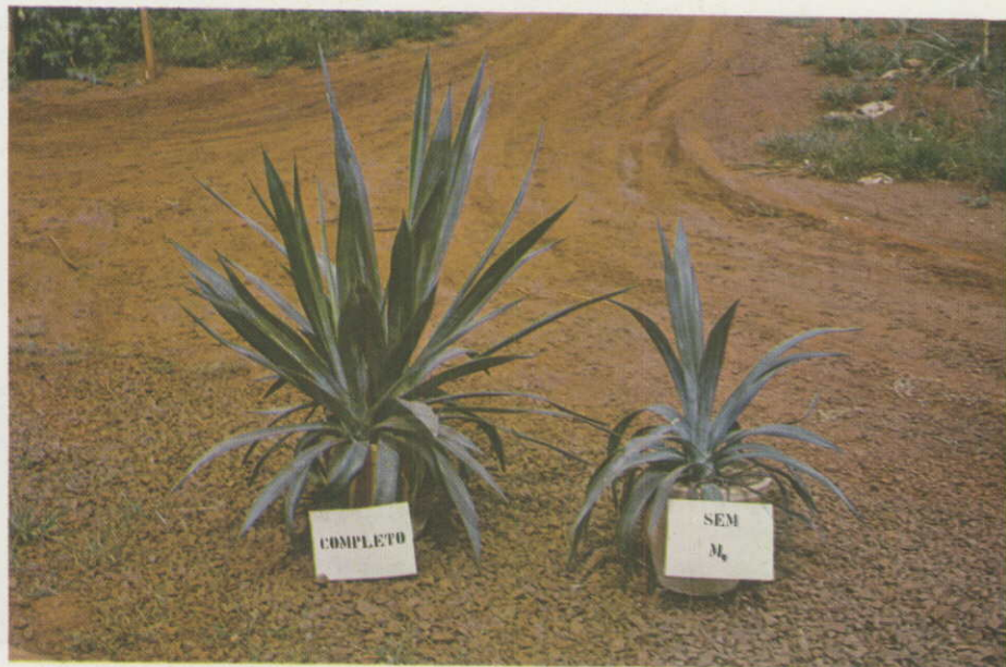
Figura 5. — Plantas tratadas com omissão de magnésio comparadas com as do tratamento completo