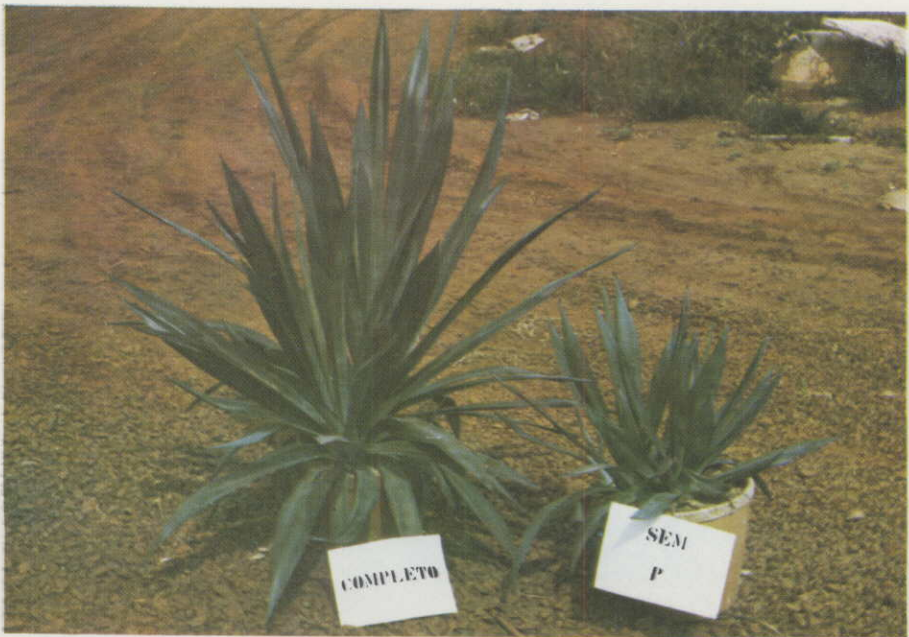
Figura 2. — Plantas tratadas com omissão de fósforo em comparação com as do tratamento completo