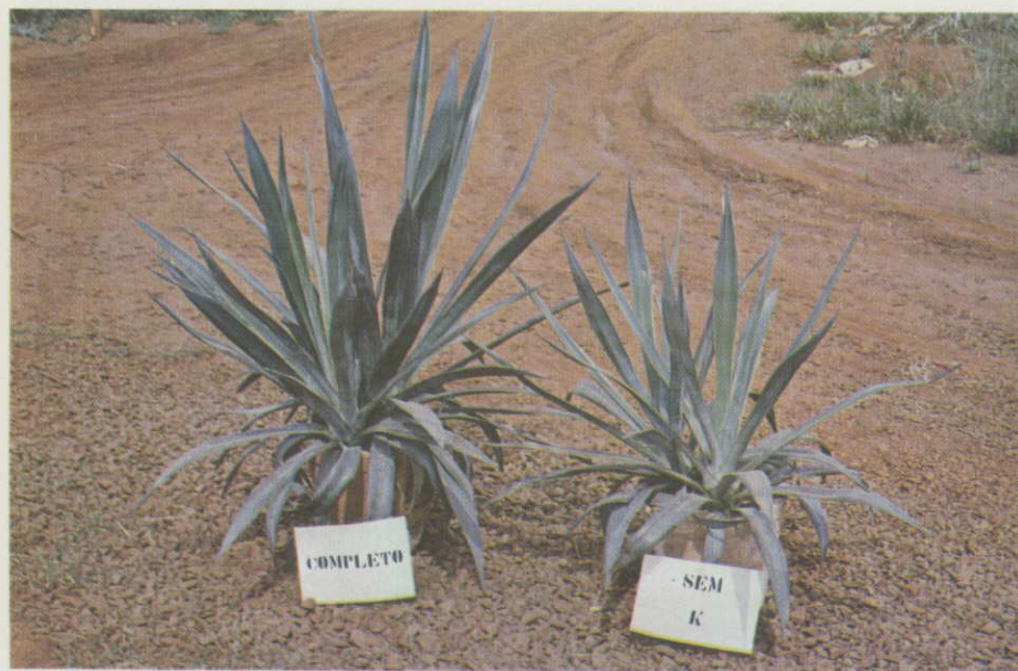
Figura 3. — Plantas tratadas com omissão de potássio comparadas com as do tratamento completo